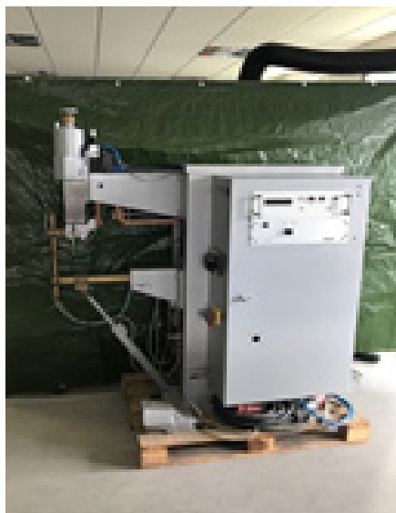
DALEX PSM 11-4 G1-DC