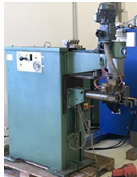
DALEX RSM 11-4 AC