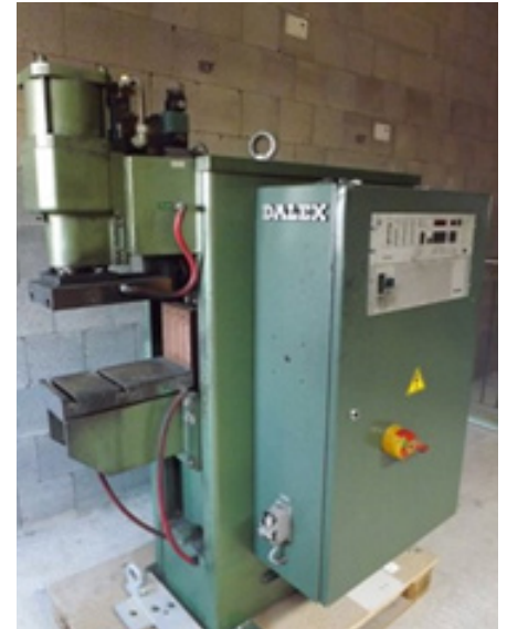
DALEX BSM 34-5-AC 2-Phasen-Wechselstrom-Buckel-Schweißmaschine

Nennleistung 180 kVA Ausladung 550 mm Schweißstrom 37 kA Elektrodenkraft 200-1200 daN