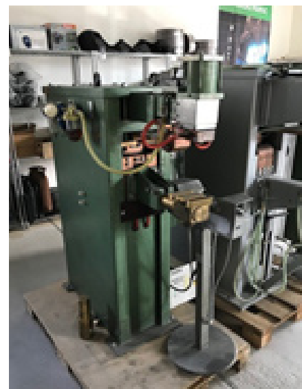
Dalex P/BSM PL 40-2-AC