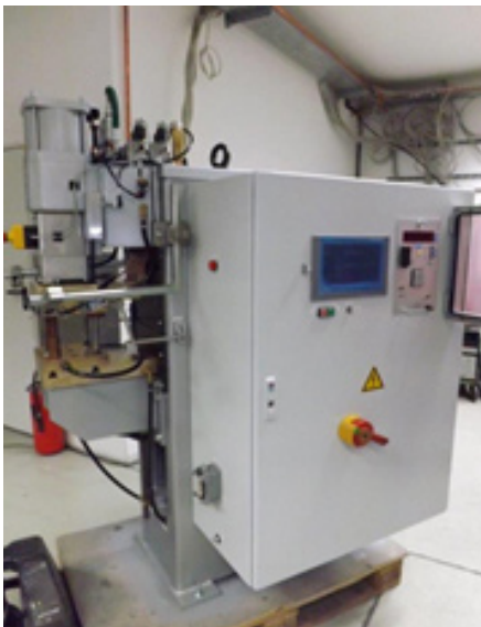
DALEX-BSM 34-5 AC 2-Phasen-Wechselstrom-Buckel-Schweißmaschine

Nennleistung 160 kVA Ausladung 350 mm Schweißstrom 70 kA Elektrodenkraft 300-1800 daN