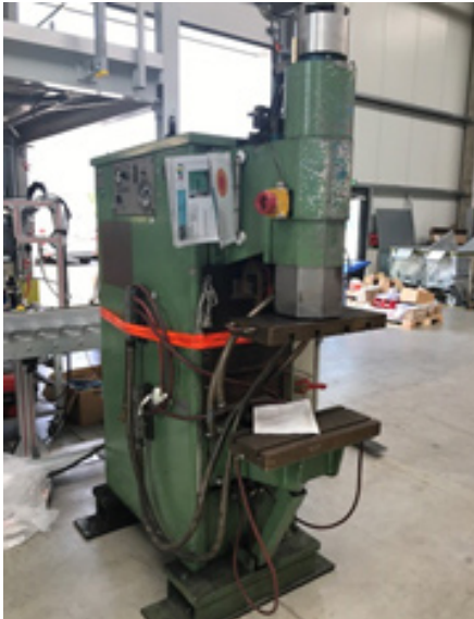
DALEX BSM 16-4-AC 2-Phasen-Wechselstrom-Buckelschweißmaschine

Nennleistung 250 kVA Ausladung 350 mm Schweißstrom 79 kA Elektrodenkraft 340-2040 daN