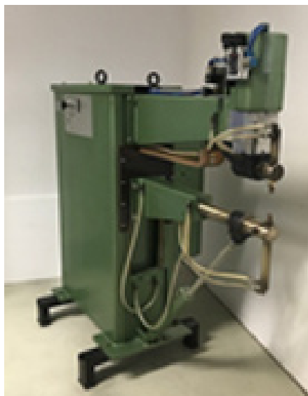
DALEX PSM 11-4-AC