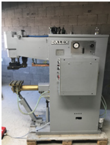
DALEX-BSM 34-5 A 2-Phasen-Wechselstrom-Buckel-Schweißmaschine

Nennleistung 160 kVA Ausladung 350 mm Schweißstrom 70 kA Elektrodenkraft 300-1800 daN